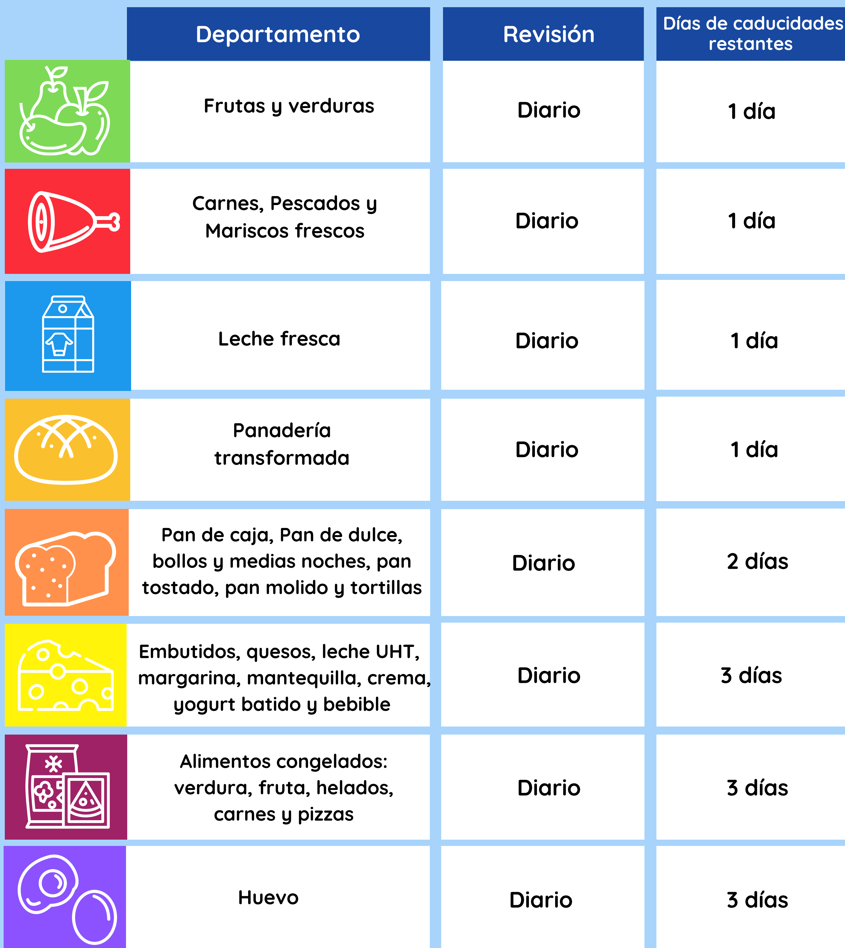
TABLA DE REVISIÓN Y VIGENCIA MÍNIMA DE RETIRO DE MERCANCÍA CON FECHA DE CADUCIDAD