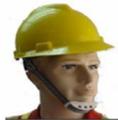
Casco con barbiquejo