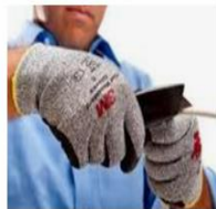
Guantes de seguridad