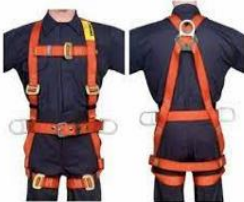
Arnés de seguridad, cuerpo completo