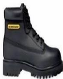
Zapato de seguridad