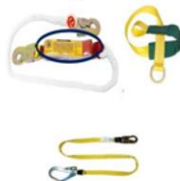
Línea con amortiguador/ sin amortiguador y eslinga.