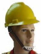
Casco con barbiquejo